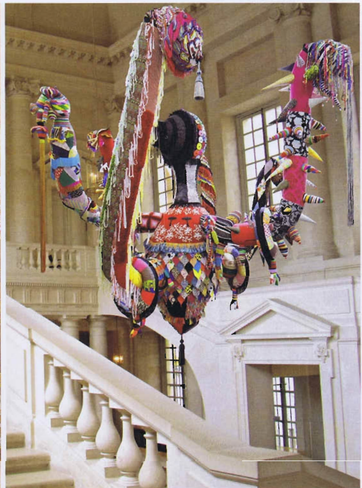
Simulations des installations de Joana Vasconcelos au château de Versailles (de gauche à droite) : Cœur Indépendant Rouge (2005) dans le Salon de la paix ; Marilyn (2011) dans la Galerie des glaces ; Mary Poppins (2010) dans l'escalier Gabriel.

seront disposées des chaussures réalisées à partir de casseroles. La guerre et la paix encerclant l'espérance. Le cœur réalisé à partir de couteaux et de fourchettes se réfère à une tradition du pays d'origine de l'artiste, le Portugal, les femmes portant un tel pendentif le jour de leur mariage pour signifier le luxe. Face aux escarpins modèle Marilyn Monroe, la tradition rencontre la contemporanéité de la star américaine. Après la femme protectrice, la femme contemporaine et la mariée, apparaît la femme guerrière . Nous sommes dans la Galerie des batailles. Cinq pièces suspendues de 6 à 16 mètres de long représenteront les Valkyries, ces déesses qui survolaient les champs de bataille et sauvaient les guerriers les plus valeureux. La dorée symbolise le luxe, la royale se pare de brocart, l'éthérée est en soie naturelle, celle réalisée en matériaux de recyclage représente l'excès, et enfin, avec la rurale, Joana Vasconcelos parfait l'image de la femme et de ses multiples facettes. Parce qu'elle veut aussi parler